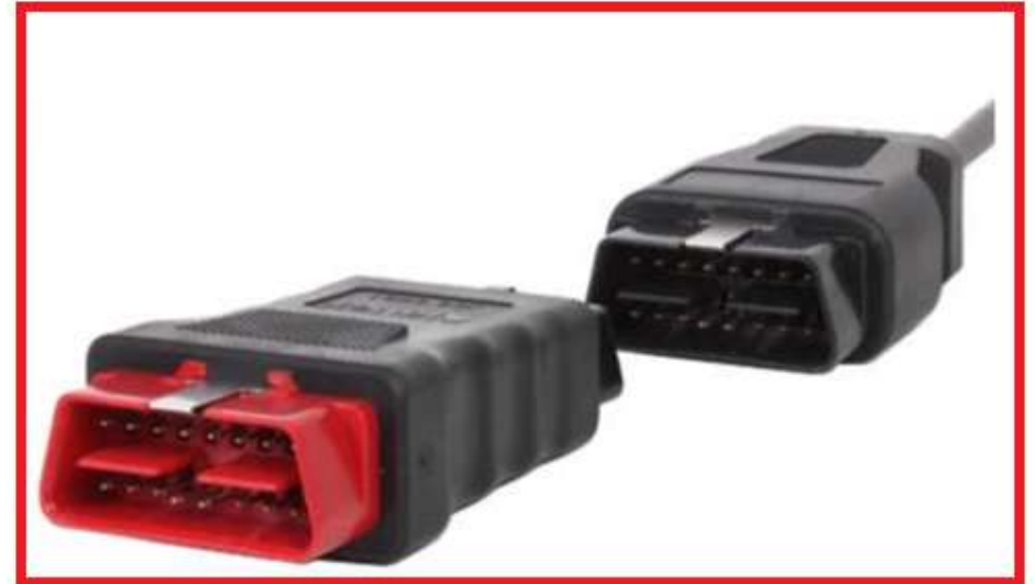
JDC 208M2 / JDC 213M2 + JDC OBD1